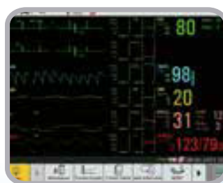
Pantalla de tendencias